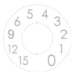
Exemple débitmètre 15l/min

Indicateur de flux : lecture simple et immédiate : 10 calibres disponibles (Exemple débitmètre 15l/min)