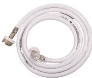
Flexible O 2