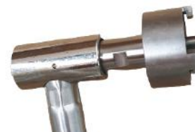
Embout coudé AFNOR