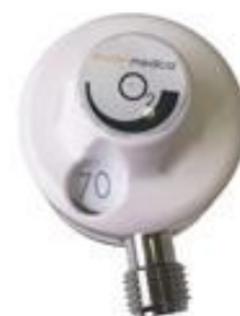
Exemple débitmètre 70l/min