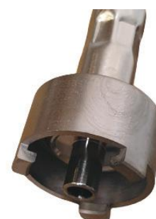
Embout droit AFNOR